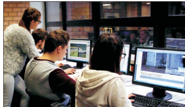
Layout und Entwurf am Rechner