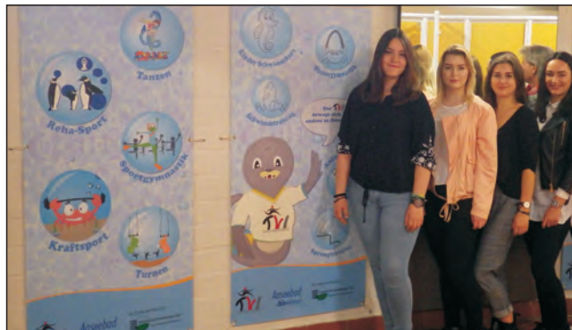
Auftragsarbeit für den TVI: Banner im Aaseebad