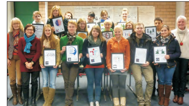
Wettbewerb für Logogestaltung

Für Schülerinnen und Schüler, die ab Klasse 7 am Lateinunterricht teilgenommen haben, besteht die Möglichkeit, das Latinum zu erwerben.