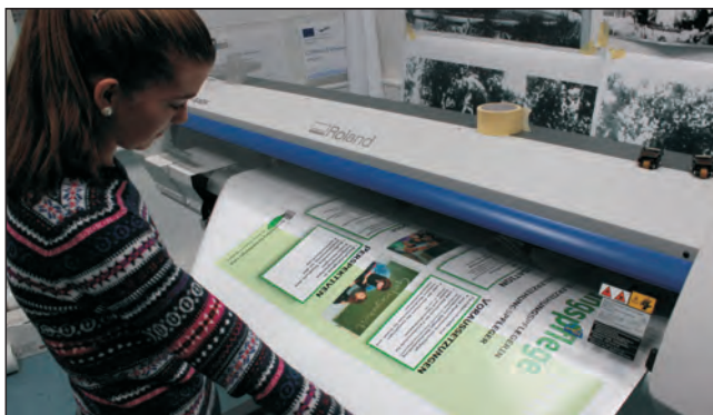
Druck der fertigen Entwürfe am Großformatdrucker

GESTALTUNGSTECHNISCHE ASSISTENTIN / GESTALTUNGSTECHNISCHER ASSISTENT UND ALLGEMEINE HOCHSCHULREIFE