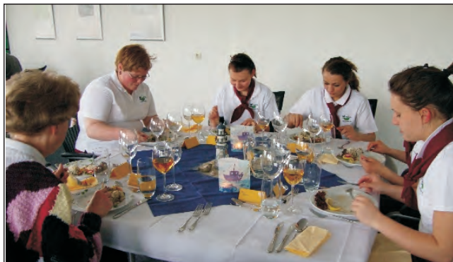
Ernährung und Hauswirtschaft

In diese Berufsfachschule werden Schüler und Schülerinnen aufgenommen, die den Hauptschulabschluss nach Klasse 9 erworben haben.